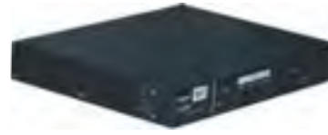
सी-डॉट ओएलटी: चतुर दामिनी

ऑप्टिकल कोर नेटवर्क (ओसीएन) – 100 जी की एक डीडब्ल्यूडीएम परियात नेटवर्क प्रणाली के लिए प्रौद्योगिकी विकास भी जारी है।