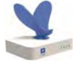
सी-डॉट ओएनटी: तितली दमक

उपलब्धियों में प्रणाली विनिर्देशन एवं वास्तुशिल्प डिजाइन पूरा होना शामिल है। इसके अलावा, मल्टिप्लैक्सर, डि-मल्टिप्लैक्सर, एम्प्लीफायर, इत्यादि जैसे प्रमुख अंगों के लिए विनिर्देशनों को भी अंतिम रूप दिया जा चुका है। नियंत्रक कार्ड हार्डवेयर डिजाइन पूरा हो चुका है तथा सॉफ्टवेयर डिजाइन प्रगति पर है। 100 जी मल्टिप्लैक्स पॉन्डर कार्ड का हार्डवेयर परीक्षण प्रगति पर है।