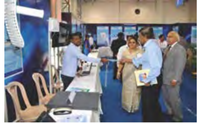
सी-डॉट स्थापना दिवस 2013 पर आयोजित प्रदर्शनी एवं सेमिनार, सी-डॉट, बंगलूरु

व्यक्तियों, उद्योग के विशेषज्ञों, शिक्षाविदों तथा सी-डॉट के वरिष्ठ प्रौद्योगिकीविदों के व्याख्यान रखे गए। सूचनाप्रद तथा संपर्कात्मक सत्रों को सभी की सराहना मिली।